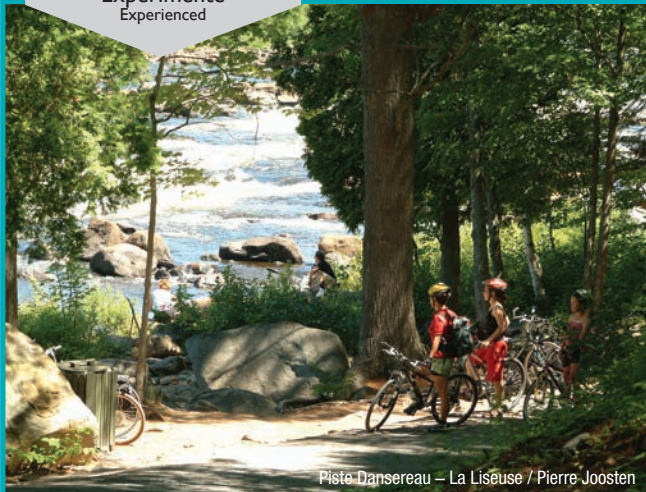
Piste Dansereau – La Liseuse / Pierre Joosten

12, rue Sainte-Anne Québec, G1R 3X2 1-877-BONJOUR (1-877-266-5687) quebecoriginal.com